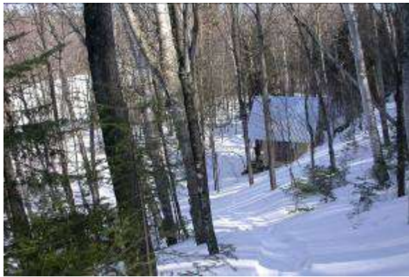
Refuge en bordure du lac de la Haute-ville

La piste de ski de fond a été inaugurée en décembre 2004. D'une longueur de 10 km, elle traverse différents peuplements forestiers qui caractérisent le piedmont appalachien, soient des cédrières, des érablières, et des sapinières. Elle est composée de 6 boucles dont les niveaux de difficulté varient de facile à intermédiaire. L'amateur de ski de fond y trouvera un dénivelé très intéressant avec de belles descentes sécuritaires. Cette piste est accessible par le rang de la Haute-Ville ou par la route Gaspard. (fig. 1), pour ceux qui veulent éviter la montée de la piste no 2.