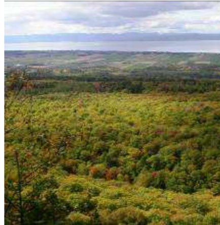
Panorama visible du sentier pédestre

Trois sentiers de randonnée pédestre et de raquettes totalisant 12 km ont été aménagés en 2006 au sud de la piste de ski de fond. Ils sont accessibles par le rang du Bonnet. Ces sentiers offrent des points de vue magnifiques sur le fleuve et la plaine du Saint-Laurent. Ces sentiers mettent en valeur le potentiel de produits forestiers non ligneux issus de différents arbres et arbustes. De plus, des essais d'implantation de champignons en milieu naturel y sont effectués.