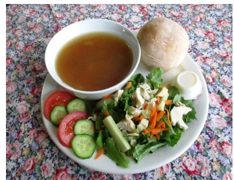
Duo soupe ou potage / 2 salades