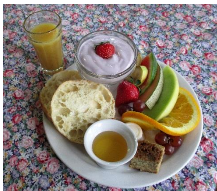
Déjeuner – À votre santé