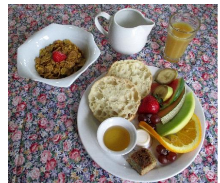
Déjeuner – Duo gourmand