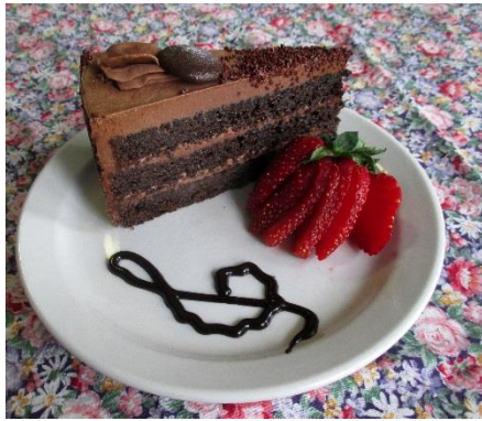
Gâteau chocolat sélect