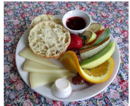
Muffin anglais avec tomme du Kamouraska