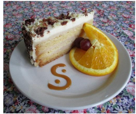
Gâteau sucre à la crème