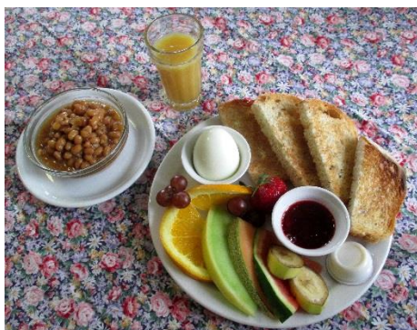
Déjeuner – Assiette québécoise