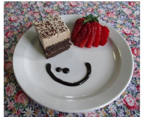
Gâteau carré au chocolat