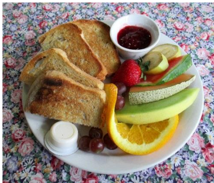
Déjeuner – Rôties de pain de ménage